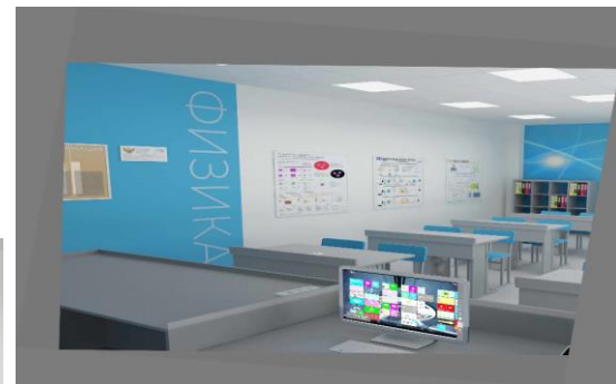
Дизайн-проект кабинета физики