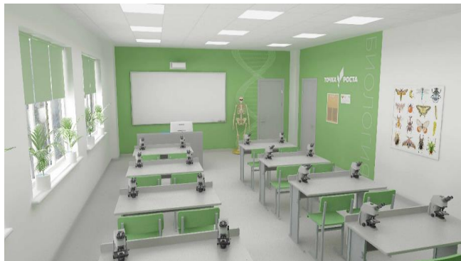
Дизайн-проект кабинета биологии